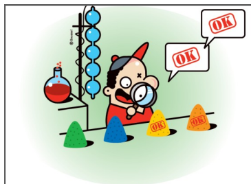
La qualité, notre atout