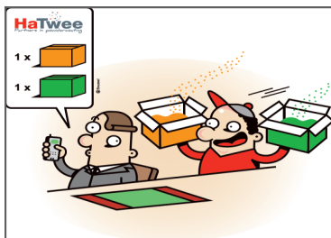
Service sur mesure