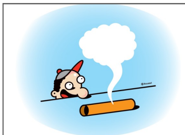
Focus sur les systèmes duplex